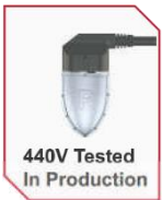
440V Tested In Production