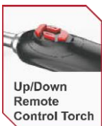
Up/Down Remote Control Torch