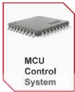
MCU Control System