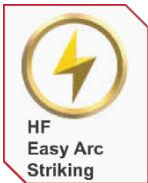
HF Easy Arc Striking