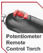
Potentiometer Remote Control Torch