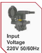
Input Voltage 220V 50/60Hz