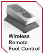
Wireless Remote Foot Control